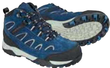
Design und Funktion wie bei den Großen, nur optimiert für die Füße kleiner Forscher. Wichtig: knöchelhohe für mehr Stabilität in schwierigem Gelände.

Deshalb weiß Nico Thomas ganz genau, was kleine Forscher und große Abenteurer brauchen. Gerade für die Kids sind gut knöchelhohe Wanderstiefel mit gut profilierter Sohle wichtig – und mückendichte Bekleidung aus robusten, aber „leisen“ Stoffen mit Verstärkungen an stark beanspruchten Stellen. Eine Kopfbedeckung gegen unliebsamen Insekten-Besuch und natürlich ein kinderfreundlicher Rucksack für Regenbekleidung, Proviant und ausreichend Trinkreserven. Spezielle Kinderlupen und Ferngläser vergrößern die Forscherbegeisterung um ein Vielfaches.