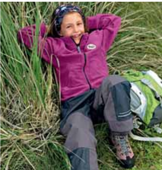
Nur Outdoor-Kleidung bietet den Kids draußen wirklich alle Freiheiten ...