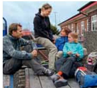
Funktional am Meer und lässig auf der Anreise: Fleece-Jacken, Softshell-Jacken in Kindergrößen und funktionelle Trekkinghosen.