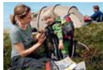
Campern in Kampen: auch die Nordseeperle Sylt bietet naturnahe und preisgünstige Urlaubs-Alternativen für Familien.