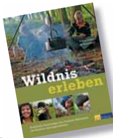
Ein praktischer Ratgeber für mehr Spaß und Sicherheit in ursprünglicher Natur – die Kids werden Ihre Ideen lieben!