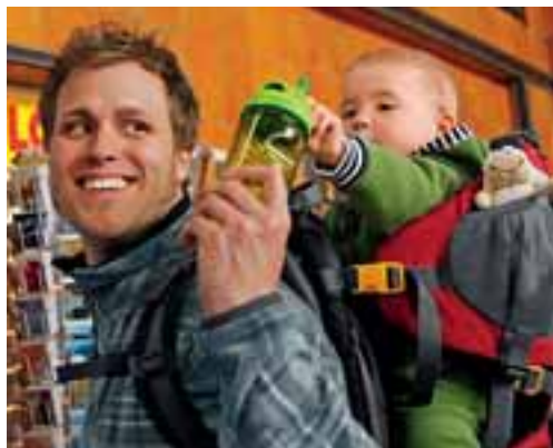
Doppelt praktisch: ergonomische Kindertrage für Reise und Wanderung – unkaputtbare Trinkflasche mit weichem Mundstück.