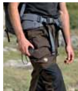
Strapazierfähiger Hosen-Klassiker aus G-1000: BW-Mischgewebe, gewachst (deshalb auch leise bei der Fotopirsch) mit vielen praktischen Taschen.